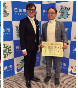
表彰式の写真 左は日進市長

夏の厳しい暑さを和らげるだけでなく、事務所を鮮やかに彩ってくれるグリーンカーテン。来年もまた、事務所の素敵なアクセントとして、そして社員一同の楽しみとして、皆様と一緒にその成長を見守っていけるよう大切に育ててまいります。