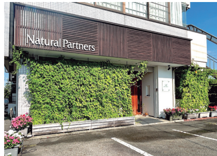
グリーンカーテン 8月の様子

このグリーンカーテンは、毎年育ててはいたものの、コンテストへの応募は今年が初の試みでした。初挑戦での受賞に驚きつつも、社員一同大変喜んでおります。